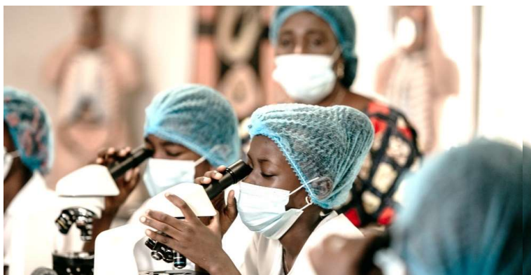
Apoio ao Setor da Educação