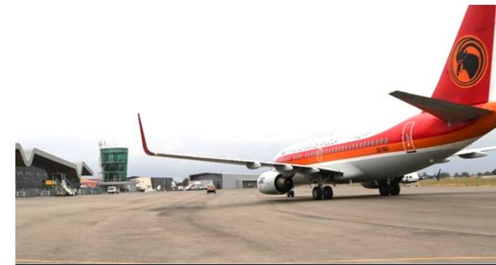
Construção de infra-estrutura e Apetrechamento