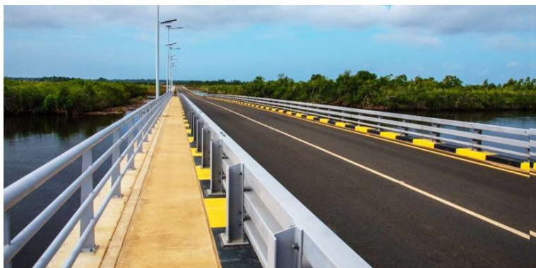
Construção de infra-estrutura e Apetrechamento