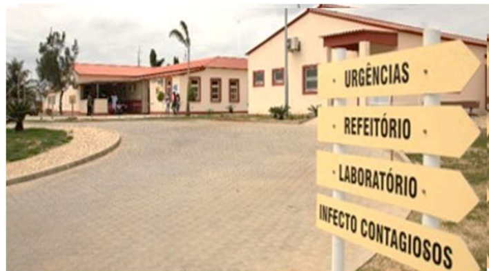
Apoio ao Setor da Saúde